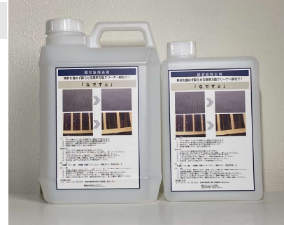
※容器は変更になる場合があります。